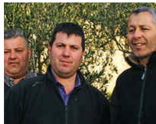
Pic Saint Loup Guilhem Gaucelm 2020 Ermitage du Pic Saint-Loup