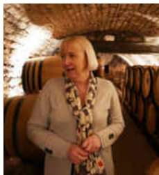
Beaune 2020 Domaine de la Vougeraie