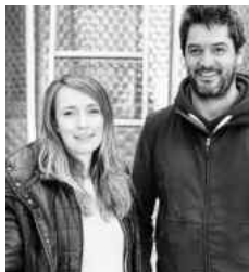
Crozes-Hermitage 2021 Domaine Graeme & Julie Bott