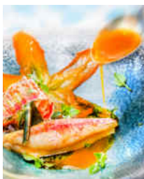
Filets de rouget de roche au fenouil